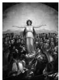
«Η Ελλάς ευγνωμοσύνη», έργο του Θεόδωρου Βρυζαίου, 1858. Αριστέρας της Ελλάδας εκκινεί την πορεία του Κοραΐ

φωση εθνικής ταυτότητας που ενέλει θα δοκίμασε στην εθνική ανεξαρτησία. Τις θέσεις αυτές μελέτη και ο Μυχαήλ Πασχάλης (The history and ideological background of Korais' Ilad project, με επίκεντρο τον αρχικό προγραμματισμό του Κοραΐ να εκδόσει την Ilada ως πρώτη έκδοση στην οπτική της Ελληνικής Βιβλιοθήκης, καθώς πίστευε ακράδαντα στα «πρωτό» του μεγάλου ποιητή.