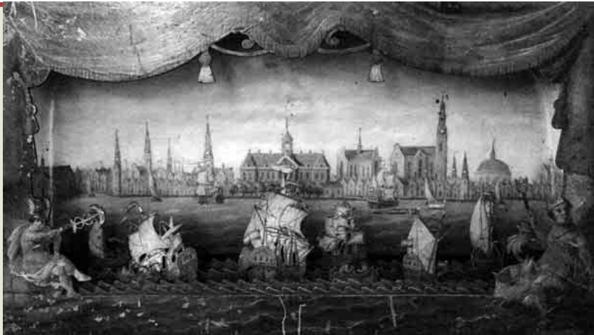
Το Αμστερνταμ την εποχή του Κοραΐ. Λεπτομέρεια από ρολόι που δούρισε ο σουβέρτος του Κοραΐ Σταμάτης Πέτρος στο Μοναστήρι του Αγίου Ιωάννου στην Πάρο

ελληνιστές. Καθώς ο Κοραΐς υπήρξε από τις μάχες του κοσμοπολιτικού γένους, επισημαίνοντας κάθε φορά οι μεταλλαγές του, οι ριζές με το παρελθόν, η ένταξη του στο περιβάλλον των «φιλοσόφων» και οι σύνοτες ενέργειές του να πραγματοποιήσει ιδέες της εθνικής αποκατάστασης.