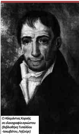
Ο Αδαμάντιος Κοραΐς σε ελαστρογραφία αριστού (βιβλιοθήκη Τυπιδάου-Ιακωβάτου, Αθήνα)

Τον δρόμο για την επιστημονική μελέτη του Κοραΐ τον άνοιξε ο Κ. Θ. Δημαράς. Παρότι είναι οι «επίγονοι» που ακολουθούν τον δρόμο αυτόν τον δρόμο. Ορισμένοι μάλιστα μπερμύσαναν με ποικίλους τρόπους να συνεχίσουν την προσπάθεια διασύνδεσης της μελέτης του Νεοελληνικού Διαφωτισμού με εκείνη του ευρωπαϊκού. Έναν τέτοιο στόχο έχει και η παρούσα εργασία: σήμερα τόμος που επιμελήθηκε ο Πασχάλης Μ. Κιτρομιλίδης, λογροκίνητρο για την έκδοση αυτή στήριξε διαπίστωση από τον επιμελητή της ότι η κορυφαία ελληνική προσωπικότητα ο Κοραΐς, που συνέβαλε αποφασιστικά στη μετάδοση των φωτών στη Νωτο-