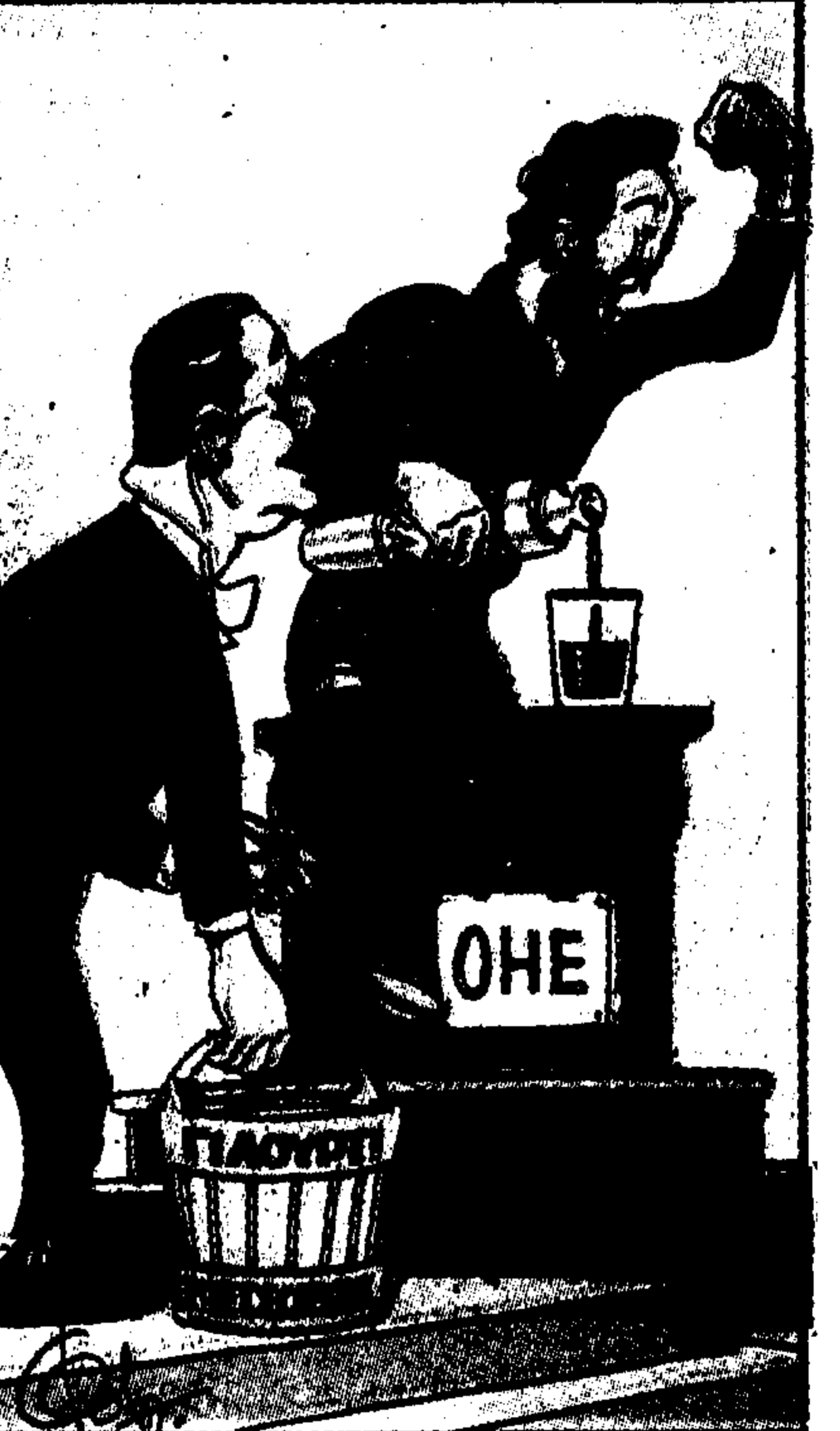
ΑΒΕΡΩΦ - 'Εγώ μπορώ να μιλήσω με ελληνικά και άσικά άρε!' (άλλα τί τά πό!). (Το σ. Φωτ. Αμπελιωτάδου)